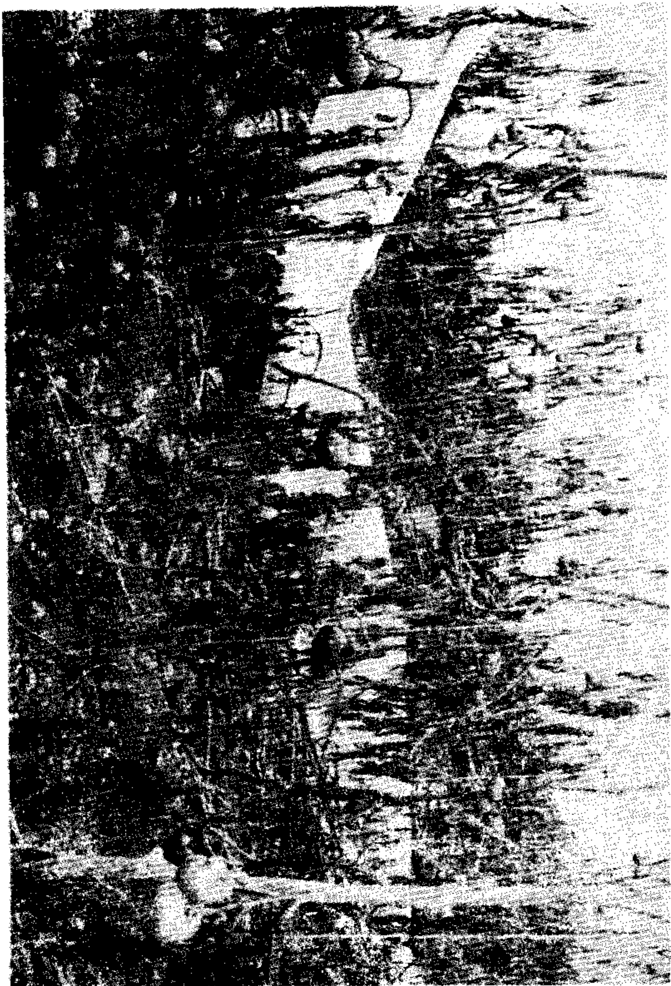
ضرد الصقوع على البندورة المزروعة في البيوت البلاستيكية